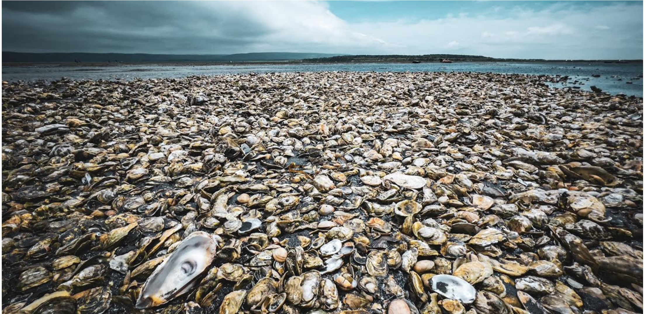
Лагуна озера Буссе